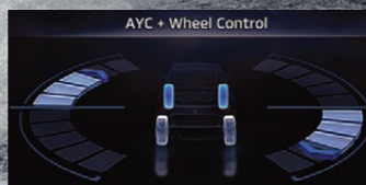
HỆ THỐNG KIỂM SOÁT VÀO CUA CHỦ ĐỘNG - AYC